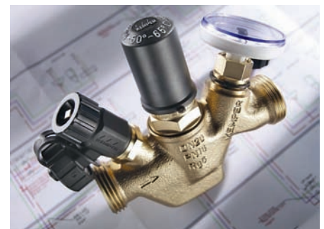
Hydraulisches Abgleichventil „Multi-Therm“.

Auch bei räumlich ausgedehnten großen Gebäuden sollte eine Aufteilung der Trinkwarmwasseranlagen in mehrere kleinere