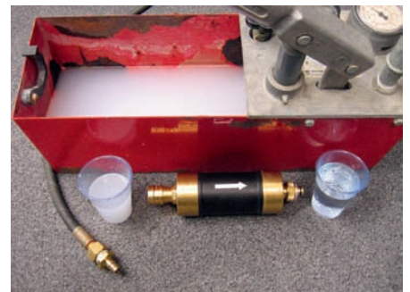
Verschmutztes Trinkwasser vor dem Hygienefilter (links) und hygienisch einwandfreies Trinkwasser nach dem Hygienefilter (rechts).

Werden die Grenzwerte nach Trinkwasserverordnung überschritten, sind das WVU (Wasserversorgungsunternehmen) und das zuständige Gesundheitsamt zu informieren. Das Trinkwassernetz des Ge-