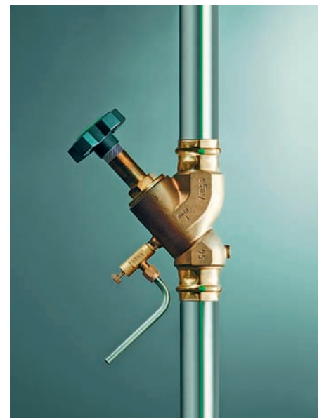
Probenahmeventil „Easytop“.